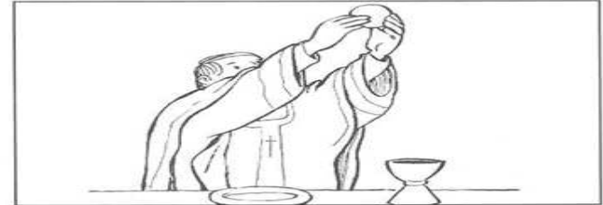
Celebrazione Eucaristica (Santa Messa)