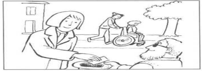
Aiuto fraterno e amore