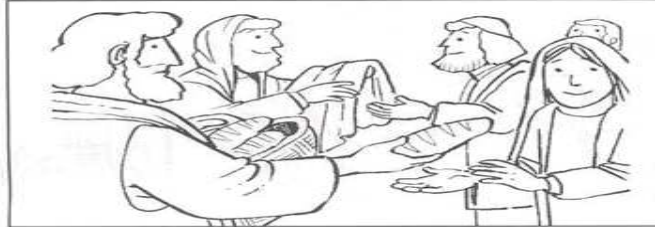
Pratica della carità verso i fratelli