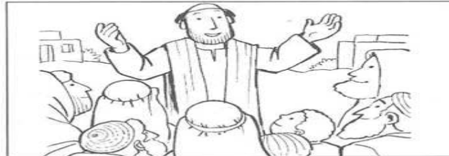
Ascolto della Parola degli apostoli