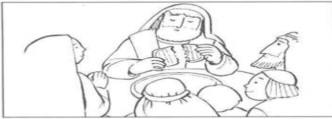
Frazione del Pane