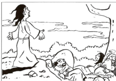
Gesù prega al Getsemani