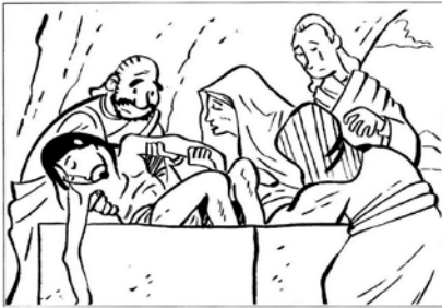
Gesù è deposto nel sepolcro