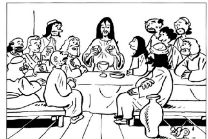
Gesù celebra l'ultima cena