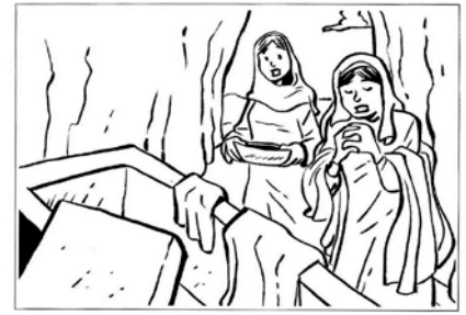
La tomba vuota