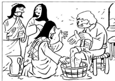
Gesù lava i piedi ai discepoli