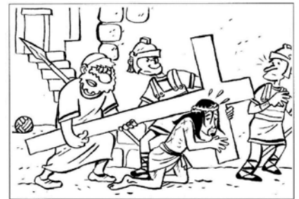
Gesù porta la croce