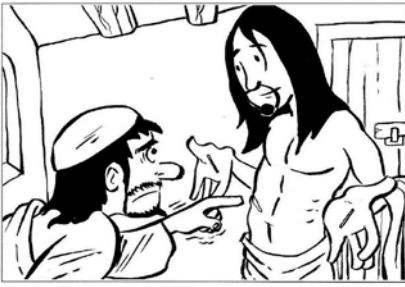
L'incredulità di Tommaso