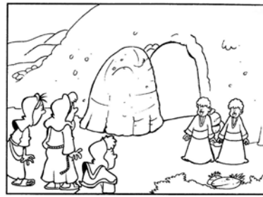
Il sepolcro aperto