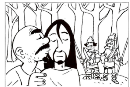
Giuda tradisce Gesù