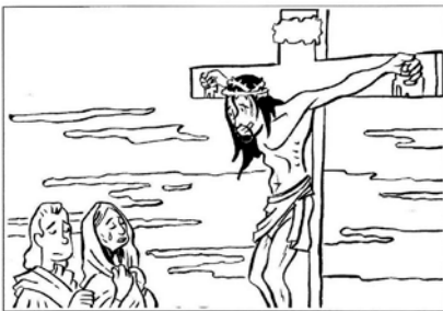
La crocifissione di Gesù