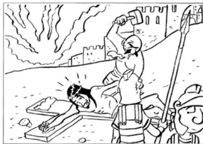
Gesù è inchiodato sulla croce