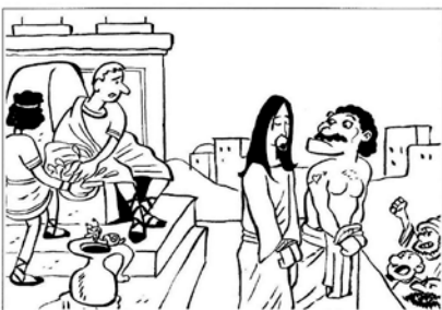
Pilato libera Barabba