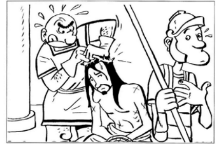
Gesù è incoronato con le spine