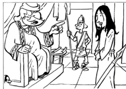
Il sommo sacerdote interroga Gesù