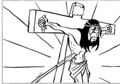
Gesù è trafitto con una lancia